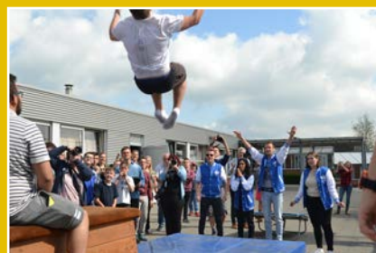
je goed voelen met al je talenten