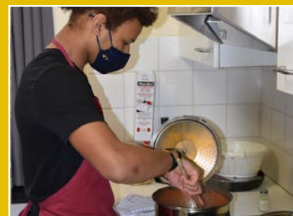
werken naar zelfstandigheid